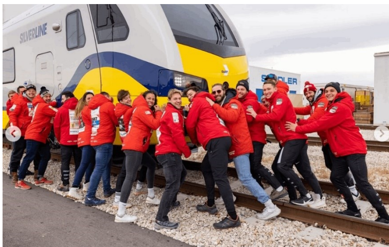
Anschieben mal anders