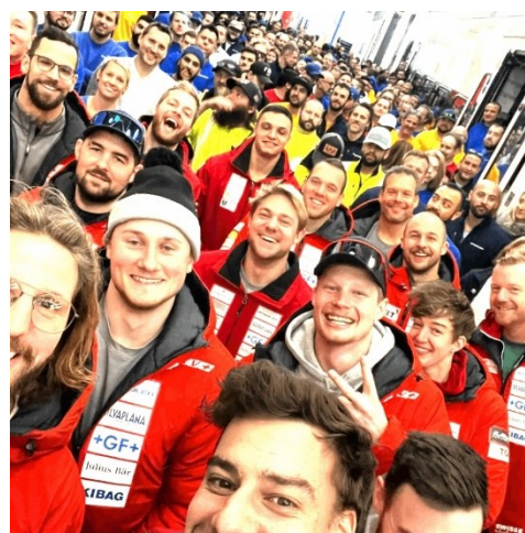
Foto mit der Belegschaft